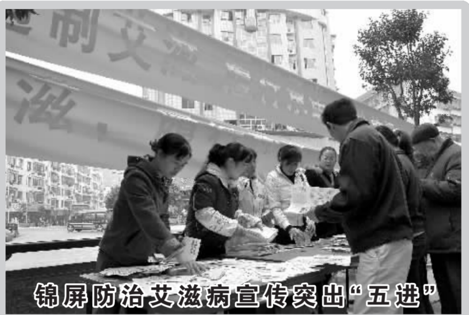
锦屏防治艾滋病宣传突出“五进”

11月26日,锦屏县卫生、疾控、人口与计划生育和宣传等部门,开展了“遏制艾滋,履行承诺,消除歧视”为主题的“进机关、进社区、进农村、进校园和进工地”的“五进”活动。